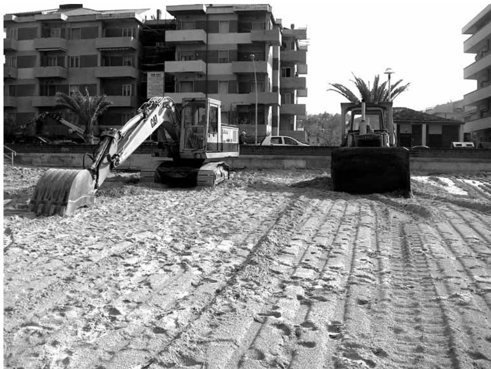
Fig. 2. Lavori di ripulitura livellamento della spiaggia ealizzata con grandi mezzi meccanici.