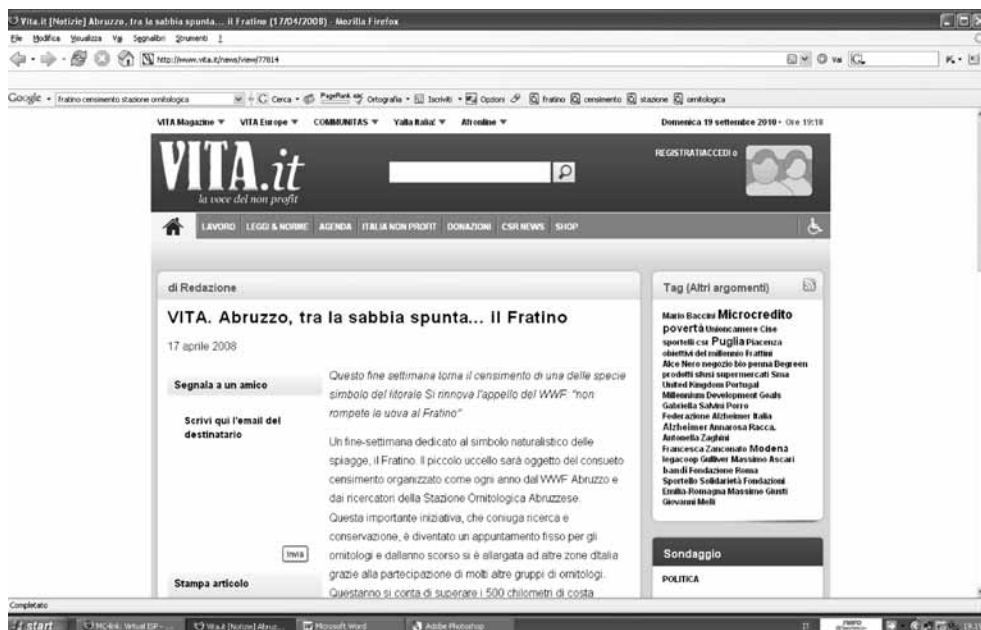
Fig. 3. Il Fratingo Day 2008 su uno dei principali siti del non profit italiano www.vita.it

esempio Molise, Puglia e Abruzzo, i gruppi locali hanno avviato azioni di denuncia per la distruzione delle covate, per la distruzione degli ambienti dunali e per l'occupazione di aree di spiaggia con manufatti (parcheggi). In tutte le regioni sono state attivate forme di tutela dei singoli nidi con cartelli e recinzioni; in alcune regioni sono stati ottenuti specifici provvedimenti da parte di autorità regionali o locali per la tutela dei nidi (ad esempio, dal 2007 vi è uno specifico riferimento alla tutela dei nidi della specie nell'Ordinanza Balneare che annualmente viene diramata dalla Regione Abruzzo).