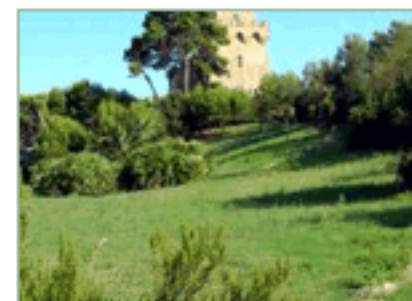
Giardini di Torre Cerrano