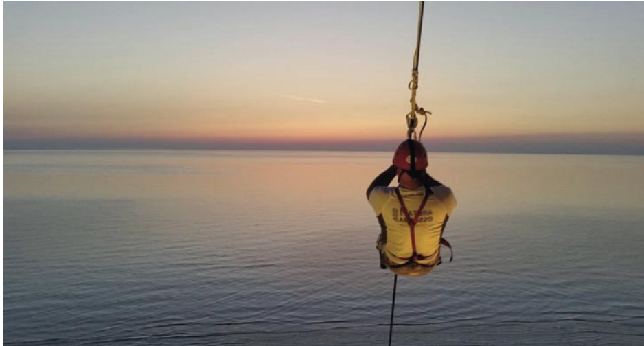
"Discesa dei quattro mari"

12/13-05-14 Gli studenti del Master Universitario di 1° livello in "Gestione della Fascia Costiera e delle Risorse Acquatiche (GFCRA)" dell'Università di Camerino partecipano per una serie di attività didattiche , riguardanti le aree marine protette e le modalità di gestione, presso la sede dell'AMP Torre del Cerrano.