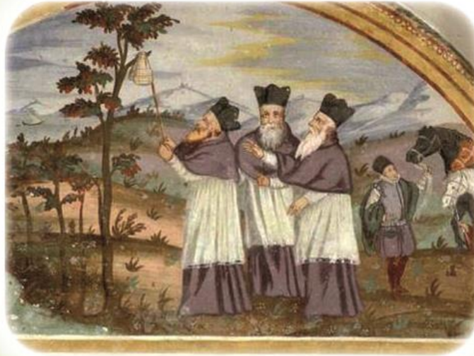
Tre pellegrini tedeschi si fermarono a riposare sotto un piccolo albero di Corniolo durante il viaggio di ritorno dalla Terra Santa